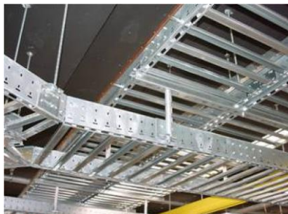
Kabelgoten en ladderbanen